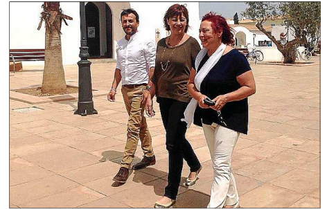
Francina Armengol, ayer, en Formentera.

plicar los compromisos de los socialistas con la isla. En cuanto a la triple insularidad, Armengol explicó que los socialistas regularán la ley de transporte marítimo y subvencionarán el transporte por mar entre islas. El objetivo es ayudar a hacer posible «esta necesidad de tanta gente».